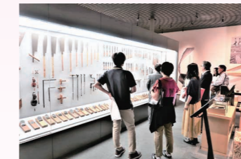
2019年竹中大工道具館